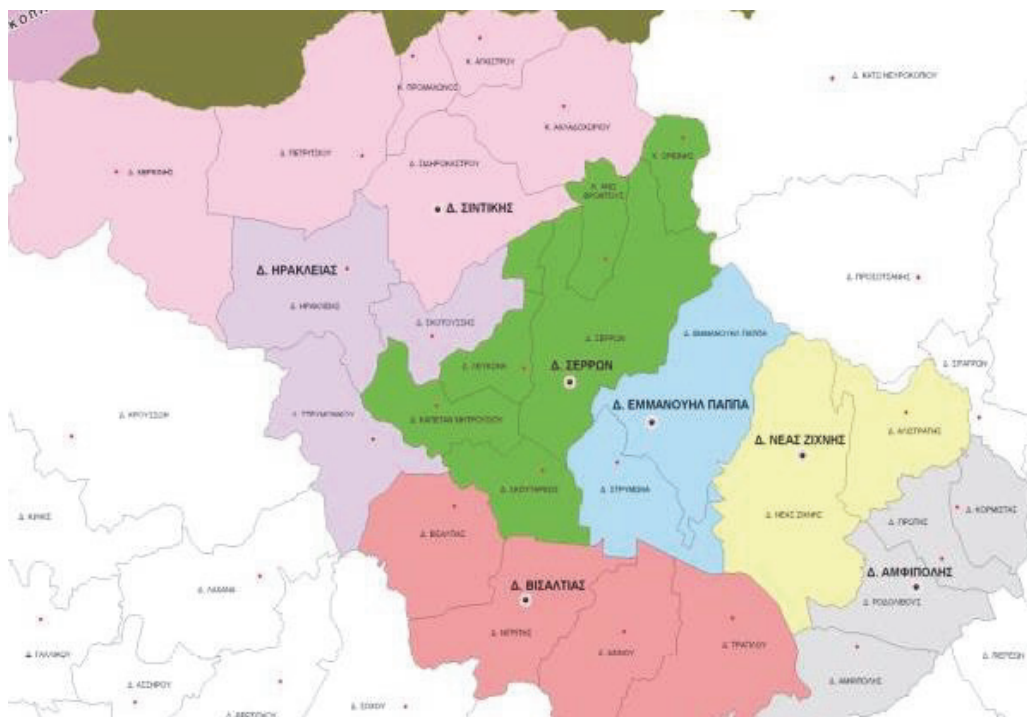
Χάρτης: Διοικητικά όρια του Δήμου Σερρών και όμορων Δήμων